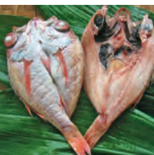
⑩のどぐろ一夜干 1~4尾 1,500円から