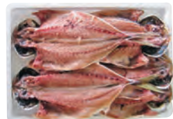
⑩瀬付あじ一夜干 4~6尾 600円