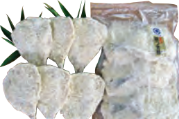
⑦瀬付あじフライ用 5~6枚 600円