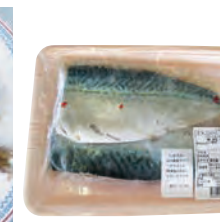
⑮しめさば(1尾入) 700円から