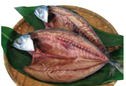
⑬さば一夜干(1尾入) 500円から