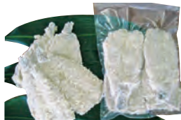
⑩かますフライ用 4~6枚 600円