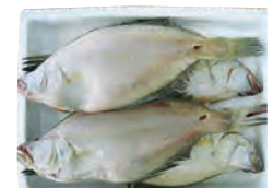
⑪かれい一夜干 3~6尾 1,200円