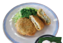
⑩釜揚げクリームコロッケ(4ヶ入) 450円