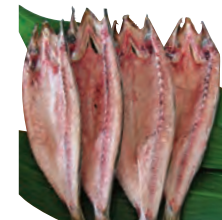
⑨かます一夜干 4~5尾 600円