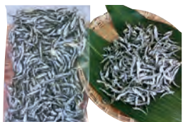
⑧かえり(真いわし) 100g 300円