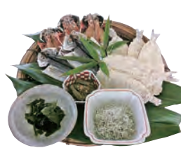
②萩の味詰合わせ 2,600円