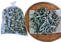
⑦つまみいらこ(真いわし) 450g 700円