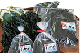
②4萩わかめ 干わかめ 刻み(手切り)・わら付 各 600円