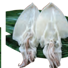
⑫剣先いか一夜干 1~2枚 1,500円から