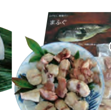
⑭鍋・唐揚げ用ふく(真ふく) (ぶつ切り) 2,500円から