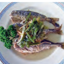
⑬瀬付あじ南蛮漬 3尾 450円