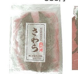
⑱さわらみそ漬 欠品