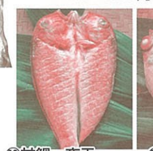
⑩甘鯛一夜干 1~3尾 1,200円から