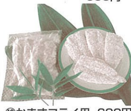
⑩かますフライ用 600円