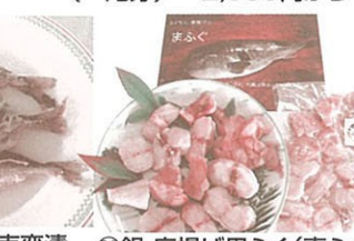
⑳瀬付あじ南蛮漬 3尾 400円