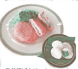
⑳釜揚げクリームコロッケ (4ヶ入) 450円