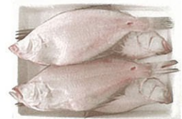
⑩かれい一夜干 3~5尾 1,200円