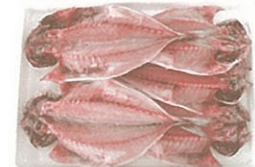
⑨瀬付あじ一夜干 5~6尾 600円