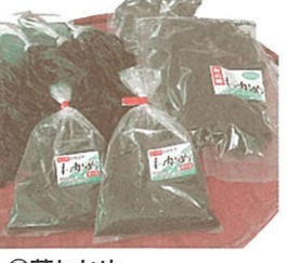
㉔萩わかめ 刻み(手切り)・わら付 みそ汁用 各600円