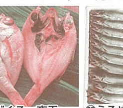
⑩のどぐろ一夜干 2~4尾 1,200円から